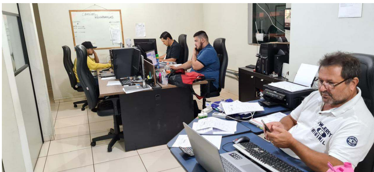
Empresa em atividade

São Paulo/SP – Av. Brigadeiro Faria Lima, 1903 – Sala 123 – Pinheiros – +55 (11) 4063-7317 São José do Rio Preto/SP – Rua Dr. Presciliano Pinto, 3194 – Alto Rio Preto – +55 (17) 3216-4004