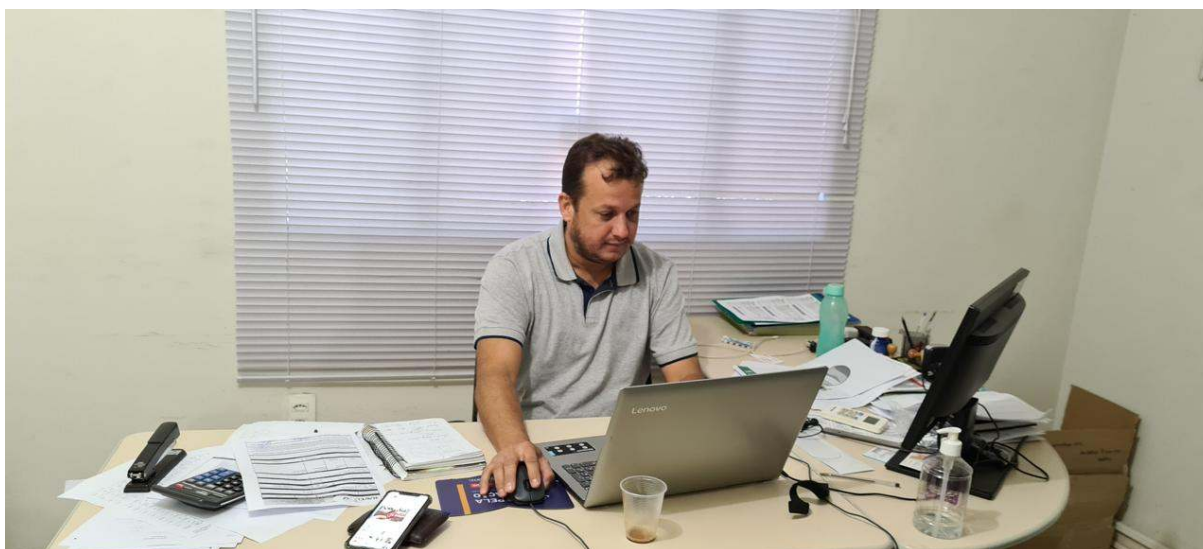
Empresa em atividade