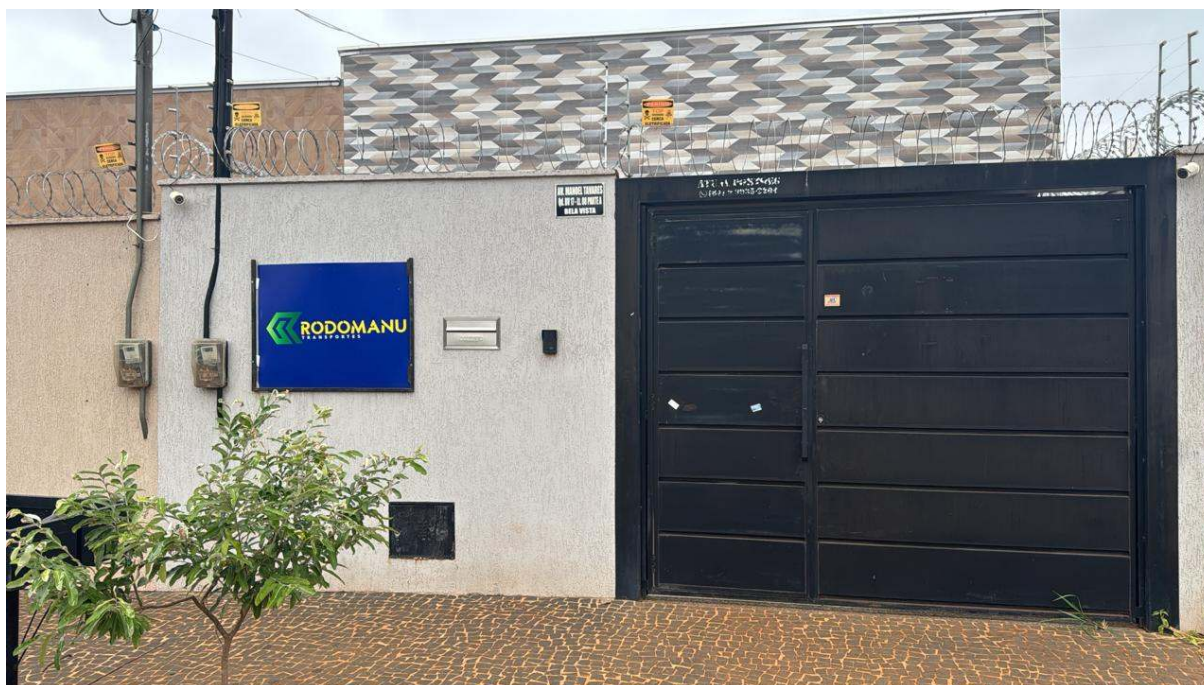
Fachada da empresa