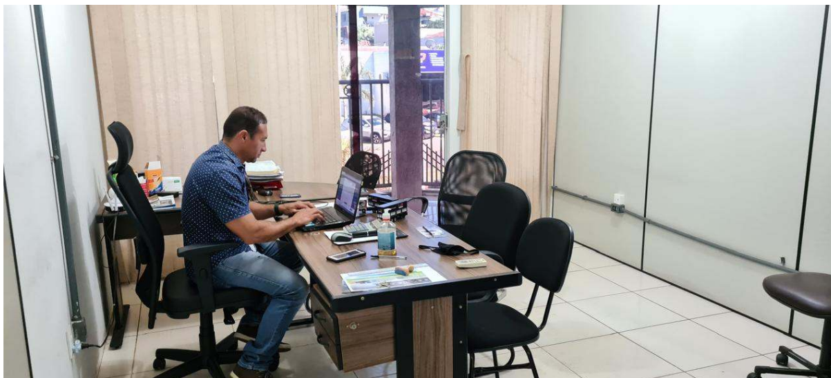
Empresa em atividade